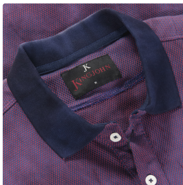
Polo Splash jacquard