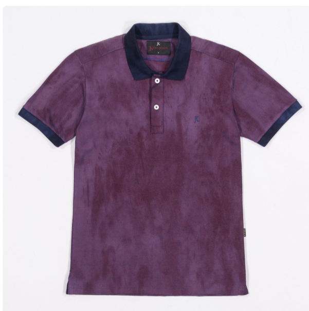
Polo Splash jacquard