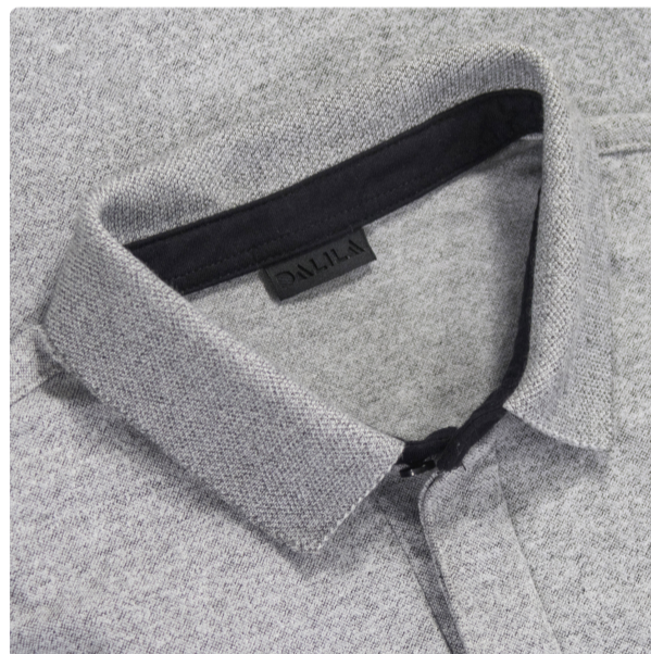
Polo Piquet molinê