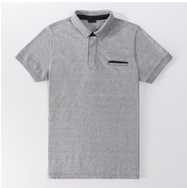
Polo Piquet molinê