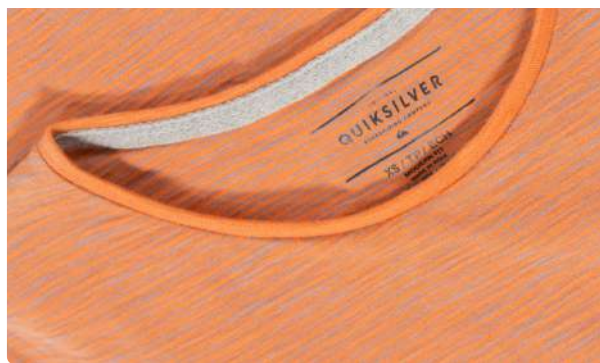
Camiseta fio a fio laranja