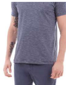
Camiseta Drazzo - Malha Dirt