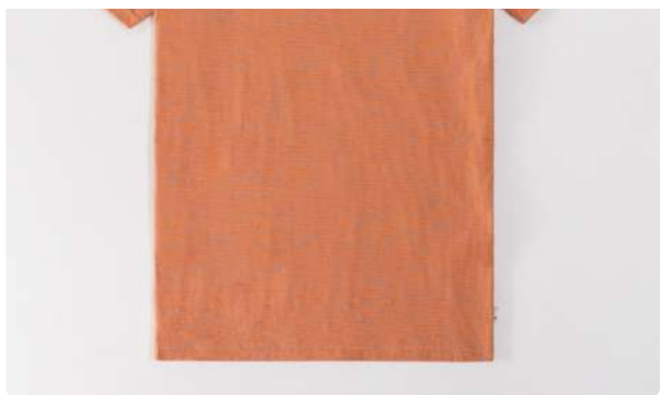
Camiseta fio a fio laranja