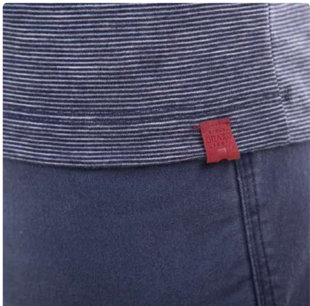
Camiseta Drazzo - Malha Dirt