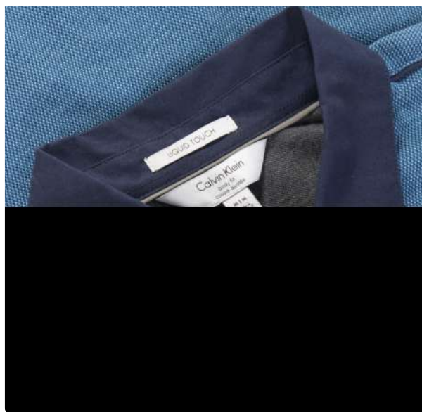
Polo piquet diferenciado azul