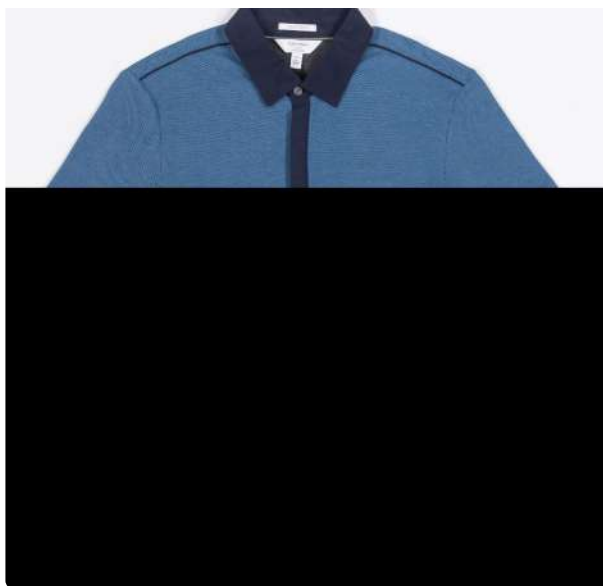
Polo piquet diferenciado azul