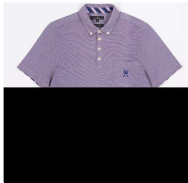
Polo piquet holografico