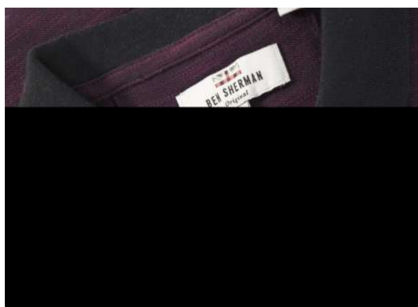
Polo Piquet Sugo